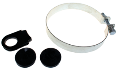
RA602K Clamp kit for RA602