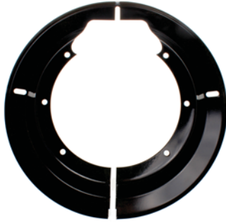
RA601 Drive axle dust shield

For 16 1/2" X 7" Drive Axles w/p and Q Brakes