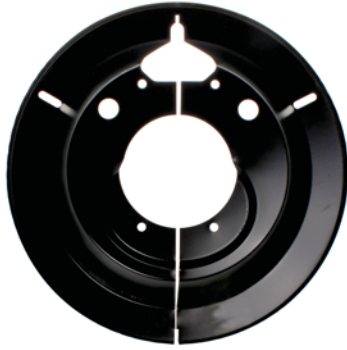
RA600 Trailer axle dust shield (Méritor style)

For 16 1/2" X 7" Meritor trailer Axles w/fabricated spider